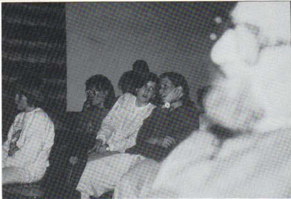
Foto: Br. Kinder zu produzieren, Flicker für große Familien u.s.f. --- Schmidl Viele, die mitgemacht haben empfanden es sehr erfüllend und bezeugten den tiefen Frieden, den sie dabei empfanden...

Nach dem Mittagessen fuhren wir, trotz schlechten Wetters nach St.Gilgen, um von dort aus mit einem Schiff den Wolfgangsee kennenzulernen. Die Abend-Aktivität hat mir besonders gefallen; wir hatten eine Diskussion über die "Schlappheit der Jugendlichen". - Im ersten Teil konnte jeder Anwesende ausdrücken, was ihm an der Kirche in irgendeinem Belang nicht gefällt. Im zweiten - wurden dann aufgrund der vorher genannten Punkte Einzelgruppen gebildet um Lösungsvorschläge zu erarbeiten.