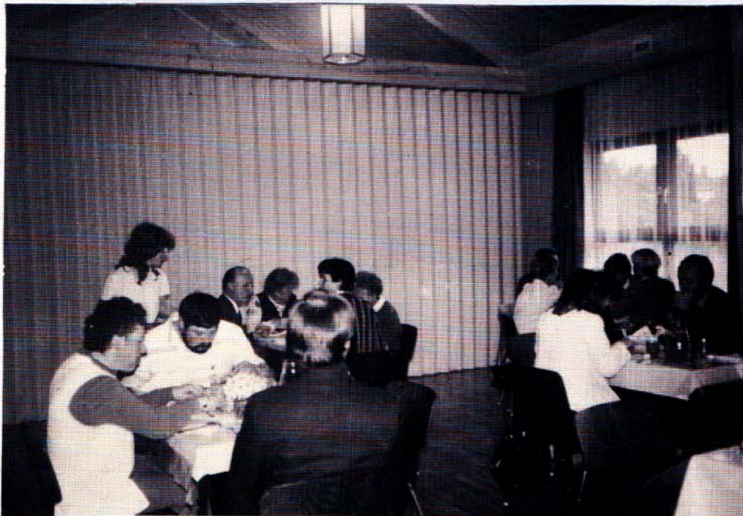
JUTA = "Mexiko" = RESTAURANT