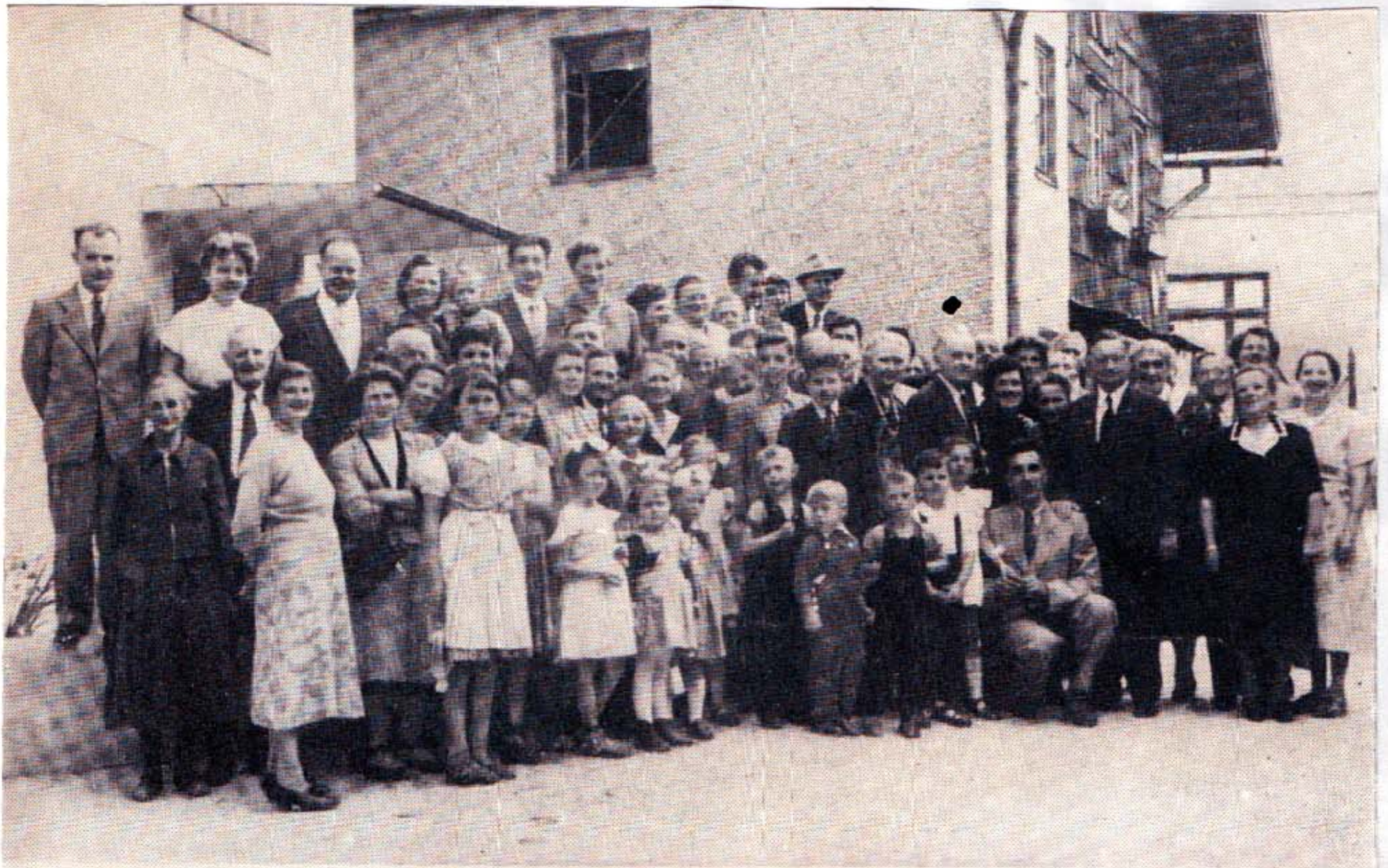
Gemeinde Haag am Hausruck anlässlich der Weihung des neuen Gemeinde-Hauses 1955 ● Spencer W. Kimball