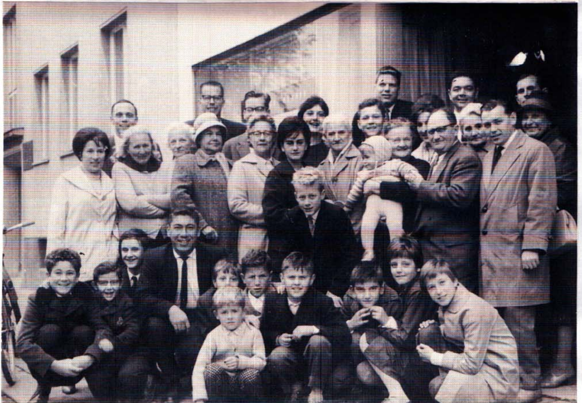
Gemeinde Wels, Salzburgerstr.45, 1.Gemeindeleokal, 1962